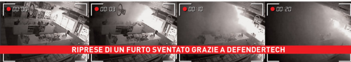
RIPRESE DI UN FURTO SVENATTO GRAZIE A DEFENDERTECH

SERIE 401 / 801 / 1601 NEBBIOGENO CON CENTRALE D'ALLARME